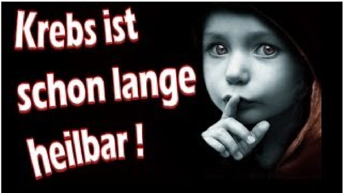
Krebs ist schon lange heilbar! (ca. 1 Stunde)