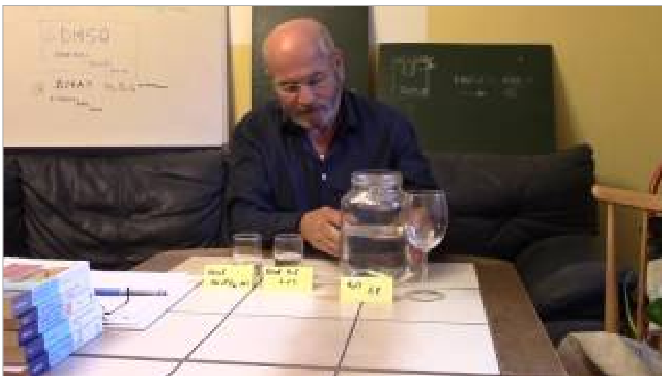
NEUE VERSION: Chlordioxidlösung (CDL) Herstellung per Gurkenglasmethode (ca. 6 Minuten)