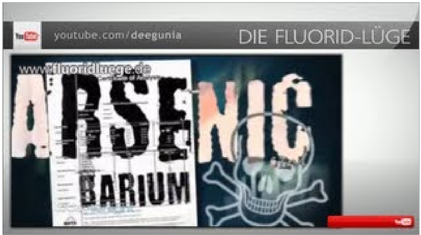
Die Fluorid-Lüge durchbricht die Zensur (ca. 7 Minuten)