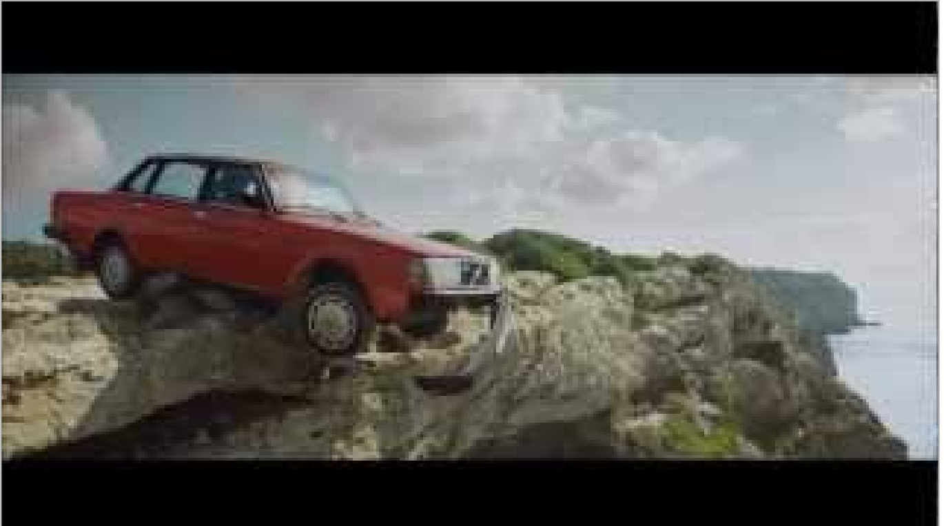
«Die Entscheidung» - Kurzfilm des Bundesamtes für Gesundheit 2013 zur Organspende (ca. 3 Minuten)

Was in dem Film nicht angesprochen wird, ist die Tatsache, dass Organe nur von Lebenden gespendet werden können und nicht mehr nach dem Tod, da sie dann für die Implantation unbrauchbar sind.