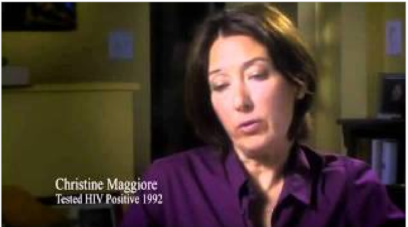
AIDS ist heilbar - nur die Medikamente töten - Die Wahrheit über HIV und AIDS (ca. 8 Minuten)