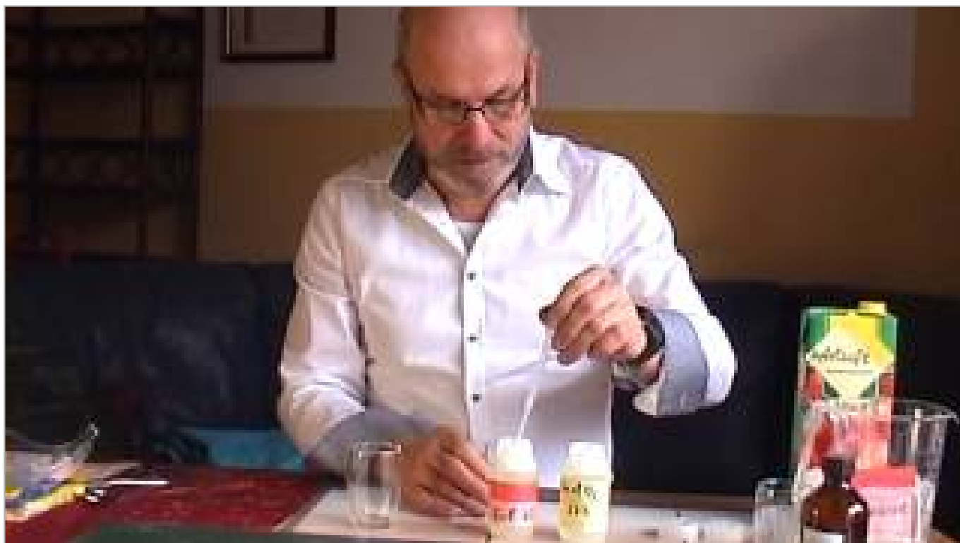
Was ist Chlordioxid MMS/CDL? (ca. 8,5 Minuten)