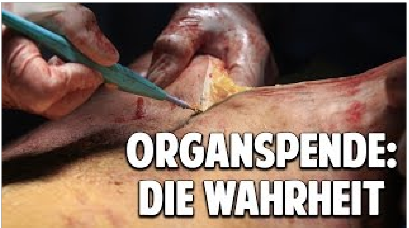
Organ spende: Die verheimlichte Wahrheit (ca. 34 Minuten)