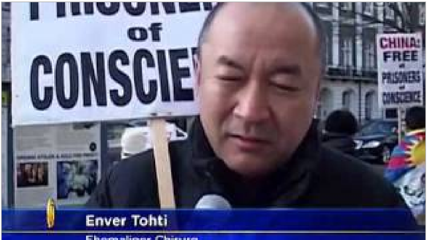
Ehemaliger Chirurg enthüllt: Organentnahme an lebenden Menschen in China (ca. 2 Minuten)