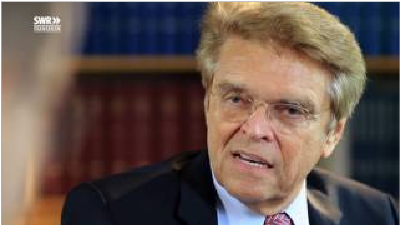
Kann ich meinem Arzt vertrauen? Fragwürdige Diagnosen und unnötige Operationen! (ca. 44 Minuten)

Ich will hier nicht die Schulmedizin generell als unnütz hinstellen, aber den Stellenwert, den sie dank der Medien in unserer Gesellschaft hat, steht ihr in keinster Weise zu: