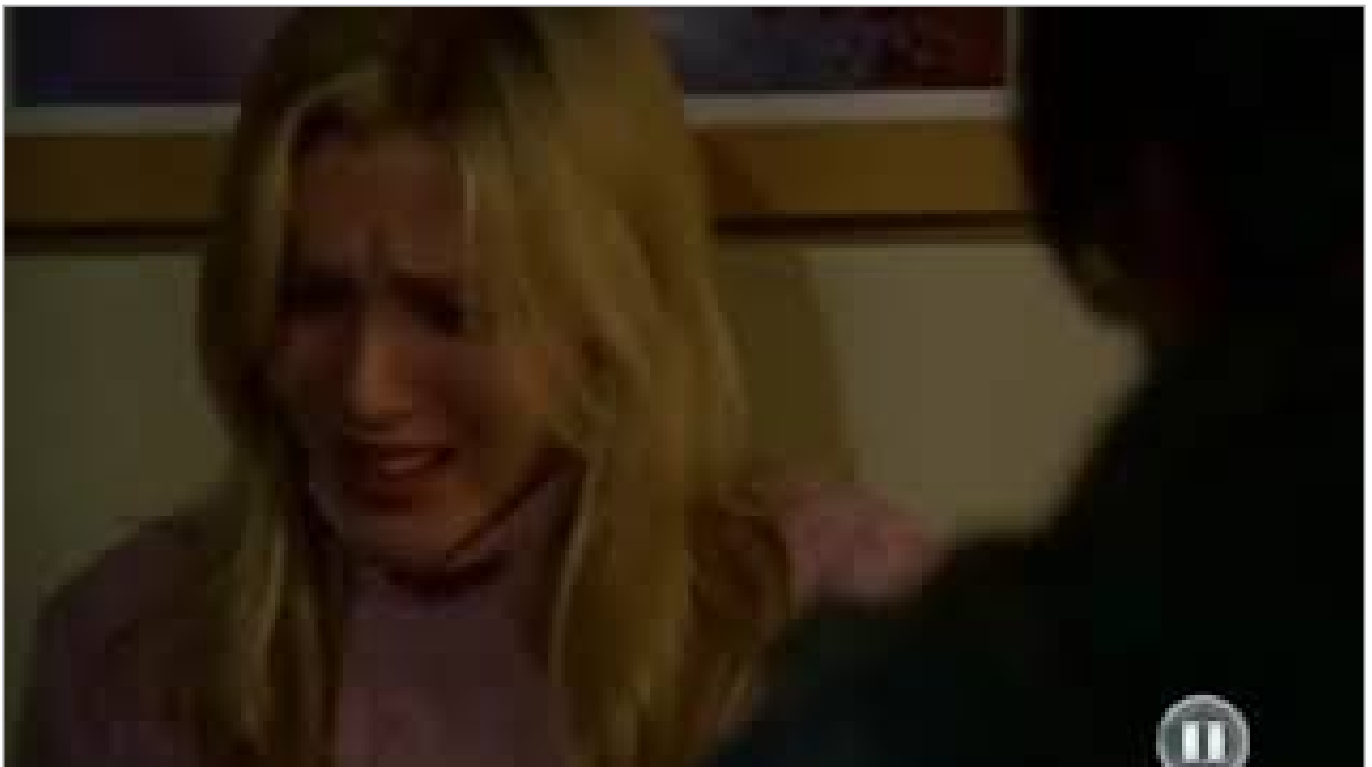
X-Faktor - Die neuen Augen (ca. 7 Minuten)

Zu der im vorherigen Video angesprochenen Wesensveränderung gibt es eine passende wahre Geschichte aus der Serie "X-Faktor: Das Unfassbare":