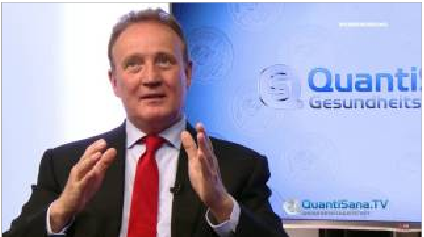
Zucker – der unbekannte Feind, Fette – die verkannten Freunde (ca. 31 Minuten)