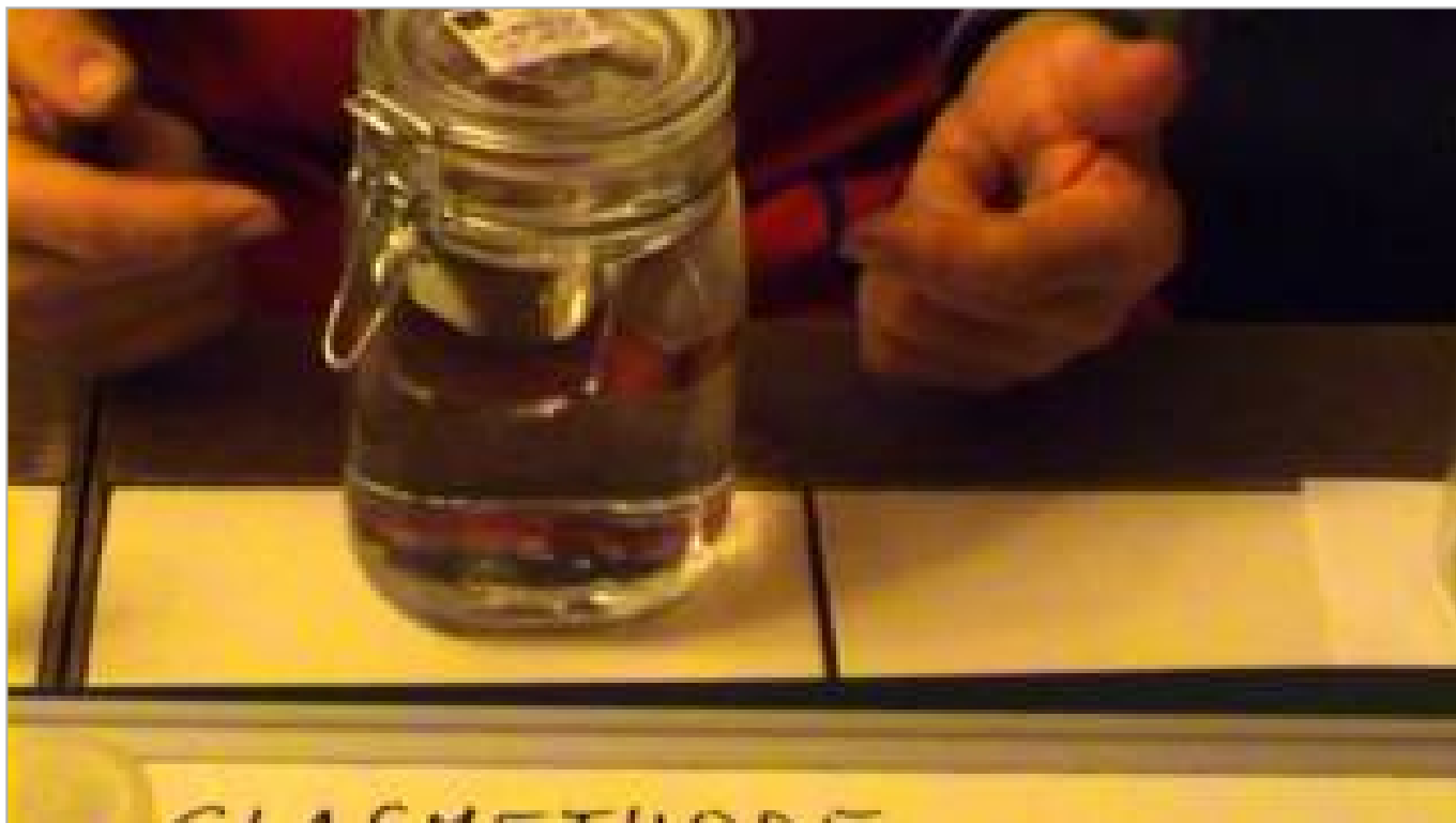
Alte Herstellung CDL per Gurkenglasmethode (ca. 8,5 Minuten)