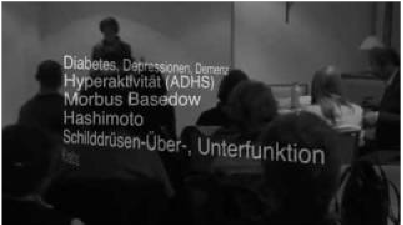
Zwangsjodierung in Deutschland (ca. 10 Minuten)