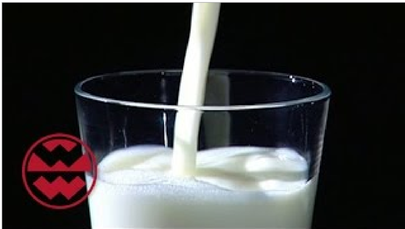
Macht Milch krank? - Welt der Wunder (ca. 8,5 Minuten)