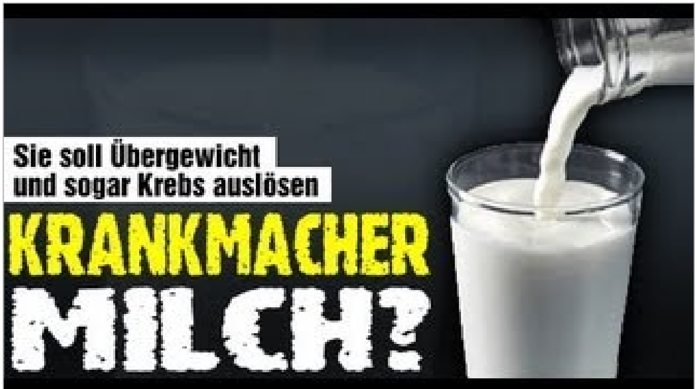
Die Milch Lüge (ca. 44 Minuten)