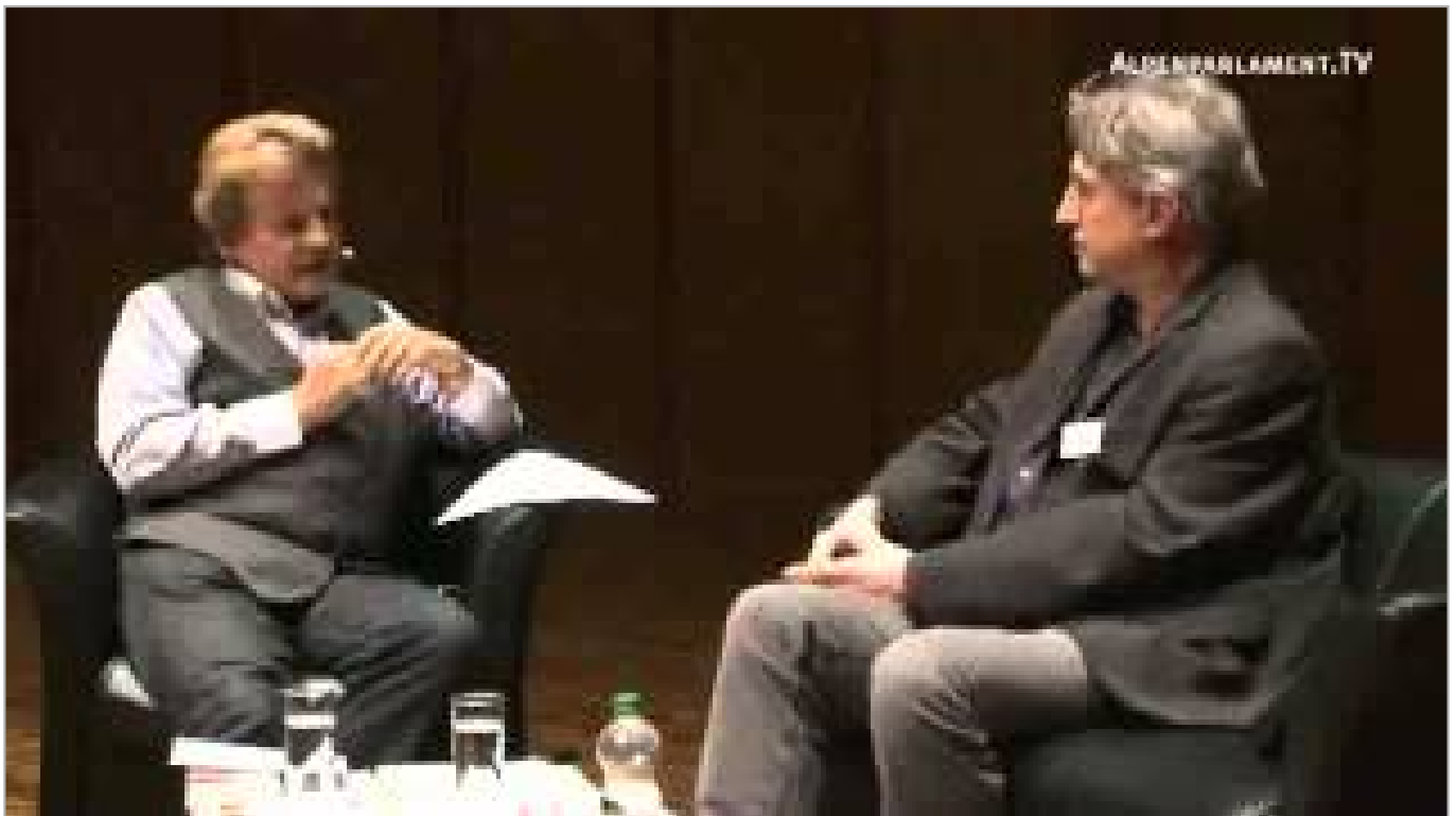
Lügen mit System - Organspenden (ca. 13,5 Minuten)