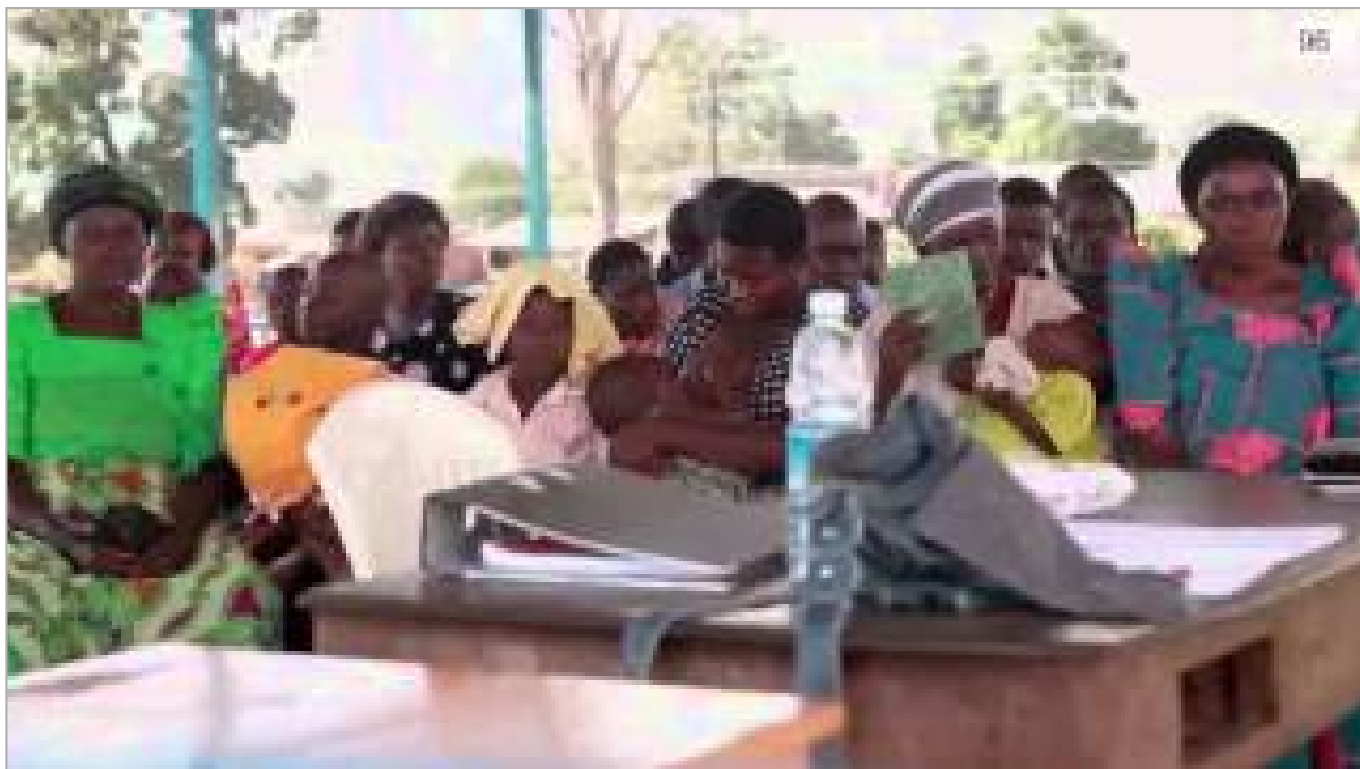
Das blutrote Kreuz - Genozid aus Profitgier (ca. 16 Minuten)