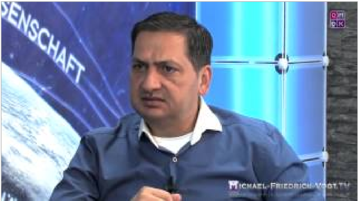
Schulmedizin - ein Kartenhaus bricht zusammen. MMS = eine Revolution in der Medizin (ca. 49 Minuten)