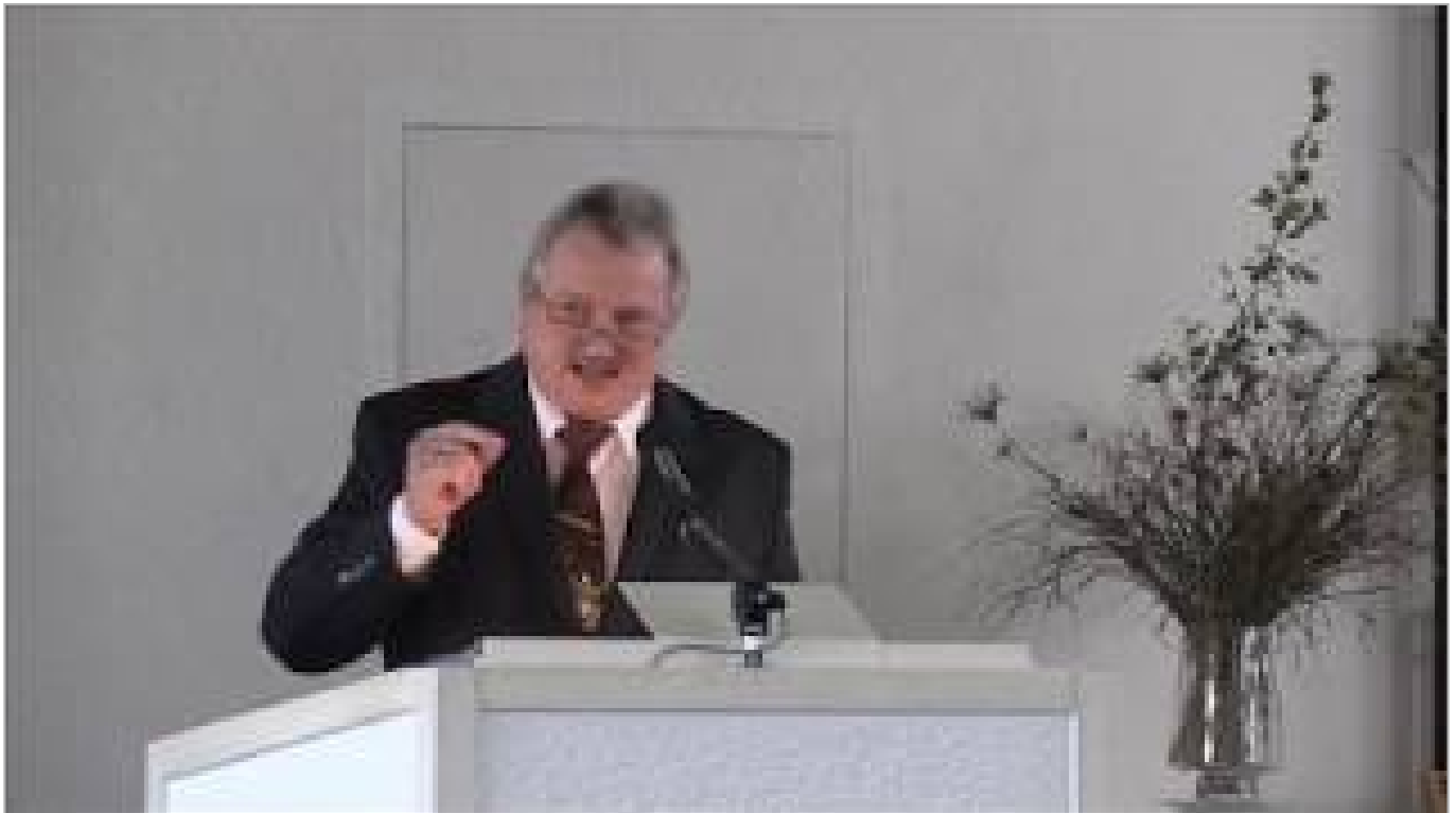
Du sollst nicht morden! – Organspende: Akt der Nächstenliebe oder Gewaltakt am Sterbenden? (ca. 1 Stunde 13 Minuten)